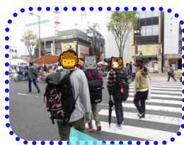
昼食どうしようか?