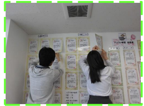
テープをはがすときは慎重に…

掲示物の整理では、卒業生の合格証書や自己紹介カードをはがしました。まっすぐに貼るのは難しく、お互いに声を掛け合ったり、紐を使ってそこに沿って貼ったりと工夫しました。貼り直しが終わり、見てみると、ガランと寂しい雰囲気…卒業生の方たちのように今後も検定取得等、頑張っていけたらと思います。また、くらぶ入り口のウエルカムボードに貼る、折り紙も折りました。説明書とにらめっこしながら、5月らしいこいのぼりやあやめの完成。お時間がありましたら、ぜひ完成品をくらぶまで見に来てくださいね。