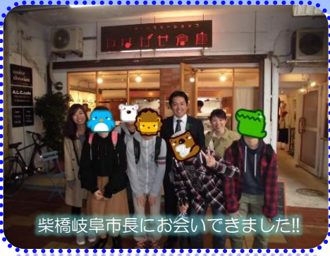
柴橋岐阜市長にお会いできました!!