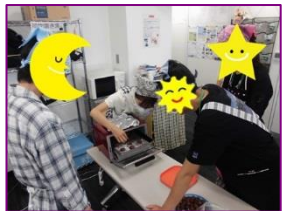
焼き具合はいかが?