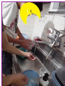
片付けもばっちゃん