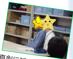
真剣に話を聴きました