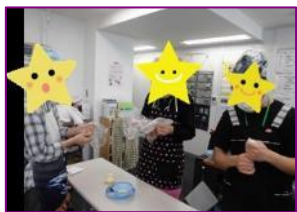
袋の中で コネコネ、こねこね