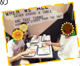
好きな物を買いました