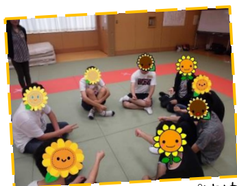
ジャンケンでグループ決め