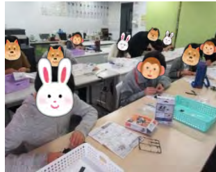
↑細かいパーツを組み合せて ました