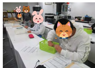
↑ボルト作業の様子