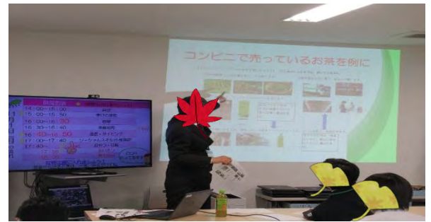
↑メモを取りながら聴きました