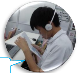
誕生日メッセージを読むKK君