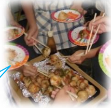
たこ焼き風おにぎりも美味しくておかわり続出です♪