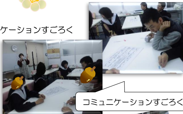
コミュニケーションすごろく

「できるだけ遅くゴールした方が勝ち！」というコミュニケーションすごろくをやりました。止まったコマのお題について会話をしながらすごろくを進めていきます。「わ～いゴールしたぁ！」と喜んでいる男子に「あがっちゃいけないんだよお～。もっとおしゃべりしないとダメなんだって～！」としっかり者の女子が突っ込みを入れ、大爆笑。再度、ゴールしないよう、会話のキャッチボールにチャレンジしていました。