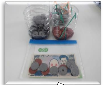
自分のお財布を作ってお菓子を購入します。