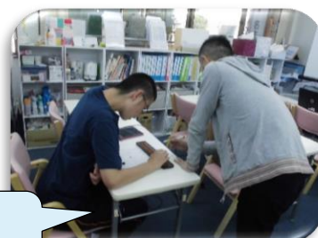
5の珠と1の珠で繰り上がり計算ができるかな