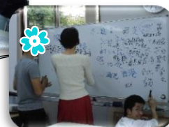
知ってる漢字をどんどん書いてみよう