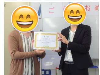
学業と両立しながら就職活動がんばりました。