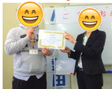
あきらめず就職活動に取り組みました。