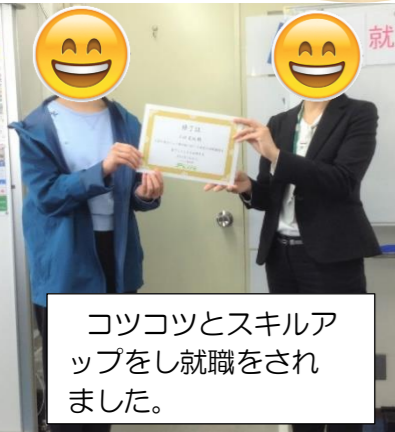
コツコツとスキルアップをし就職をされました。