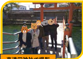
真清田神社で撮影

「アンガーマネジメントを学び自分の感情をコントロールできるようになってきた」 「ストレス解消法を実践しています」 「リフレーミングでポジティブに物事を考えるようにしています」 「月に1回のウォーキングが楽しみです」