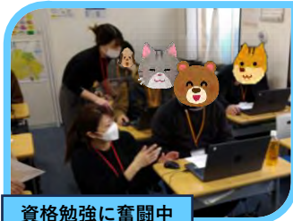
資格勉強に奮闘中