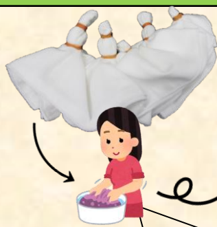
どんな模様になるかは染めてからのお楽しみ

最終的に染め終わった製品は「いきいきガーゼたおる」として福祉関係のイベントなどで販売されています。